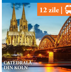
CATEDRALA DIN KOLN