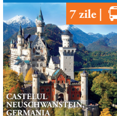
CASTELUL NEUSCHWANSTEIN, GERMANIA

Reducere de pana la 15%. De la 268€ /pers.