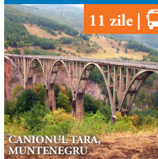
CANIONUL TARA MUNTENEGRU

Reducere de pana la 15%. De la 399€ /pers.