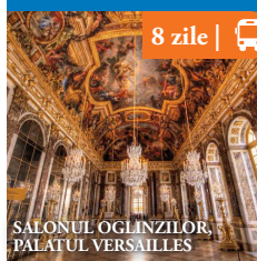
SALONUL OGLINZILOR, PALATUL VERSAILLES