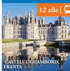
CASTELUL CHAMBORD, FRANTA