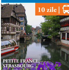
PETITE FRANCE, STRASBOURG