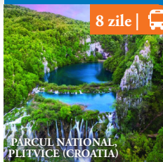
PARCUL NATIONAL PLITVICE (CROATIA)

Reducere de pana la 15%. De la 279€ /pers.