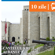
CASTELUL KRUJE ALBANIA

Reducere de pana la 15%. De la 239€ /pers.