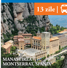
MANASTIREA MONTSERRAT, SPANIA