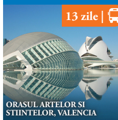
ORASUL ARTELOR SI STIINTELOR, VALENCIA