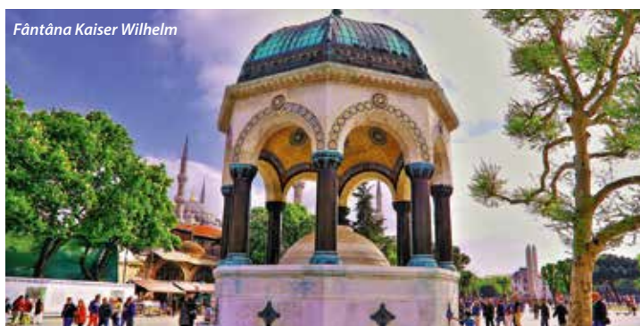
Fântâna Kaiser Wilhelm