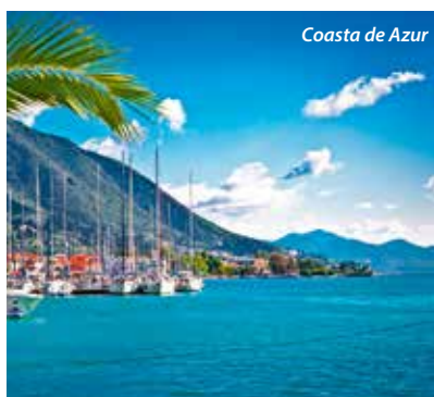
Coasta de Azur

Torino – Bra – Genova – Cinque Terre – Coasta Ligurica – Coasta de Azur – Asti