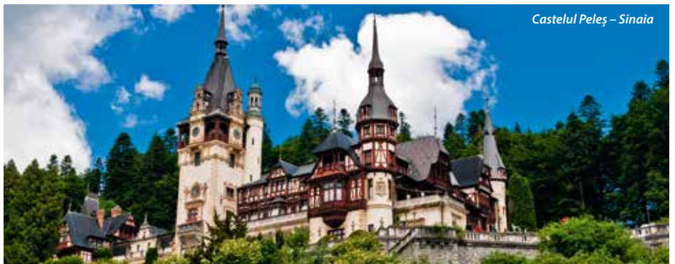
Castelul Peleş – Sinaia