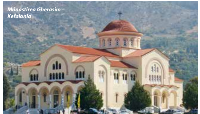
Mănăstirea Gherasim – Kefalonía