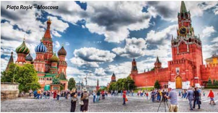
Piața Roșie – Moscova

Moscova – Kremlin – Sergiev Posad – St.Petersburg – Ermitaj – Petrodvorets – Pushkin – Pavlosk