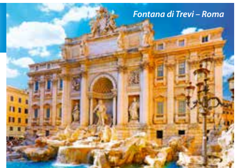
Fontana di Trevi – Roma