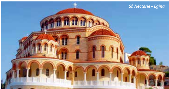
Sf. Nectarie – Egina

Sf Paraskeva – Kalambaka – Kato Xenia – Atena – Egina – Insula Evia – Salonic