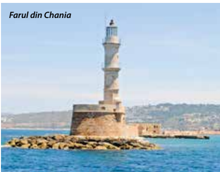
Farul din Chania

Date de plecare: 22.05.2016 și 27.09.2016