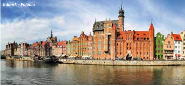
Gdansk – Polonia

Budapesta – Banska Bystrica – Cracovia – Auschwitz – Katowice – Varsovia – Mazuria – Malbork – Gdansk – Gdynia – Sopot – Poznan – Berlin – Dresda – Praga – Brno – Bratislava